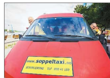
«ER'E NOE SØPPEL HER?»: Bilen er ikke noe glis, men gutta inni kompensere så godt de kan.

De første par årene kostet søppeltaxi mer enn det smakte for Hansen, men det siste halvannet året har det vært grønne tall i